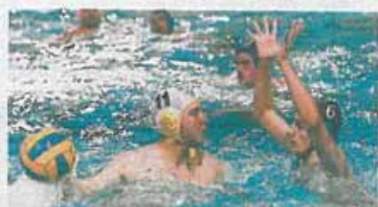
La cita disputada en El Olivar fue un auténtico éxito.