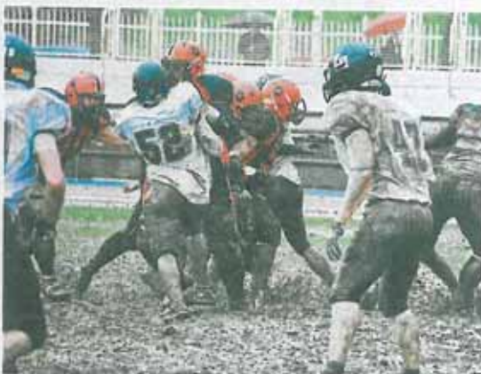
Los Hurricanes, en un momento del partido. AFICIÓN