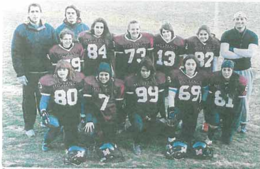
Formación de las Mustangs en su hogar deportivo, el campo de Villanueva de Gállego. HORNETS

Fueron las virtudes del legendario caballo mustang las que inspiraron el nombre de un equipo que aspira a hacerse un hueco en el panorama nacional del fútbol americano femenino. Fuerza, garra, resistencia, fortaleza... características de un animal de raza, valores que impulsan a un grupo de chicas que debutan este fin de semana en la máxima categoría, la LNFA femenina. «Las jugadoras están con unas ganas tremendas de estrenarse en la competición, asumen la responsabilidad y van a dar la cara por mostrar una buena imagen», asegura el técnico Javier Lanz. Las Villanueva Mustangs, nombre de