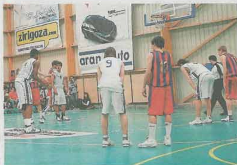
Hablando de 'clásicos'... También los hubo en el torneo. EL OLIVAR

en la élite años después de su presencia en esta competición.