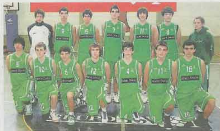
El equipo cadete masculino de El Olivar. EM EL OLIVAR

Todos estos equipos, junto a los anfitriones y a los venidos de otros puntos de la geografía española, darán colorido a las distintas canchas en las que se buscará a un campeón de la quinta edición del Torneo Nacional Yudi-gar.