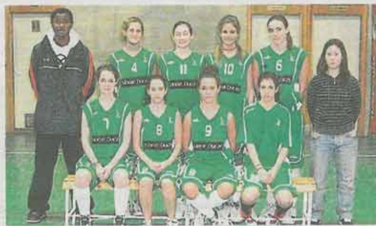
Plantilla del equipo cadete femenino de El Olivar.